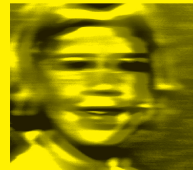
720° d'Ishtiaque Zico MAGIC FOR BEGINNERS de Jesse McLean

Un plan séquence d'un voyage entrepris pour découvrir les différentes couches relationnelles qui lient l'homme et la nature et les nombreuses perceptions de la réalité en deux rotations complètes. La technique de narration exploite la force des éléments sonores non-diégétiques et explore la liberté des choix de cadrages.